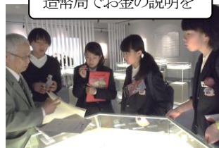
造幣局でお金の説明を

2 月 12 日(金)に 2 年生は「大阪ウォッチング」を実施しました。班で協力しながら、地下鉄・市バス一日乗車券で大阪市内のスポットを巡り、意外と知らない大阪の地理や歴史、文化、自然などに触れることができました。大阪を訪れた人に大阪の名所を案内できるようになればいいですね。わが町“おおさか”を愛するきっかけになってくれればと思います。