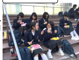
科学館前でお弁当