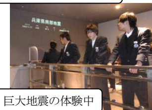
巨大地震の体験中