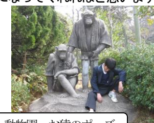
動物園。お猿のポーズ