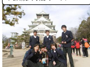
大阪城天守閣でハイチース