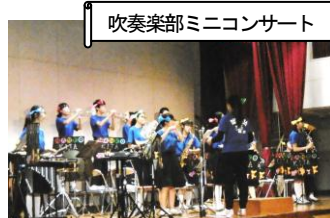
吹奏楽部ミニコンサート