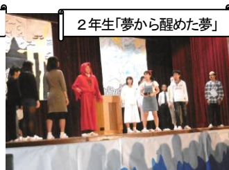
2 年生「夢から醒めた夢」