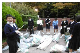
回収物の一部です

それにしても、すいがら、空き缶、ボーリングのボール！といろんなものが落ちていて、1 時間弱でごみの山です。捨てないマナーが大切ですね。参加した皆さん、ご苦勞様でした。これからも美しい町づくりをしましょう。