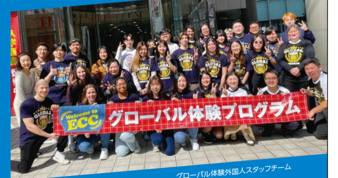
グローバル体験外国人スタッフチーム

大阪府内に所在する高等学校等の生徒および中学3年生を対象に、外国人スタッフとの英語だけを使った、実践的英語体験を実施します。海外留学やホームステイ、外国人スタッフと共に英語で動画をつくるアクティビティなど、参加いただくコースごとに、受講者に英語の発話を楽しくながすシチュエーションを用意。さまざまな模擬施設を活用し、外国人と自然に英語で交流を図ることができるコミュニケーション能力・感覚を育成します。受講者の海外に対する興味を喚起し、外国人と英語で対話することの楽しさと必要性を気づかせるプログラムです。