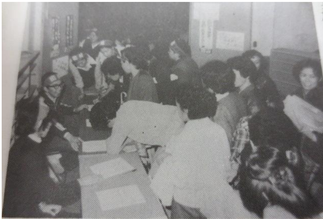
交渉につめかける父母・地域住民