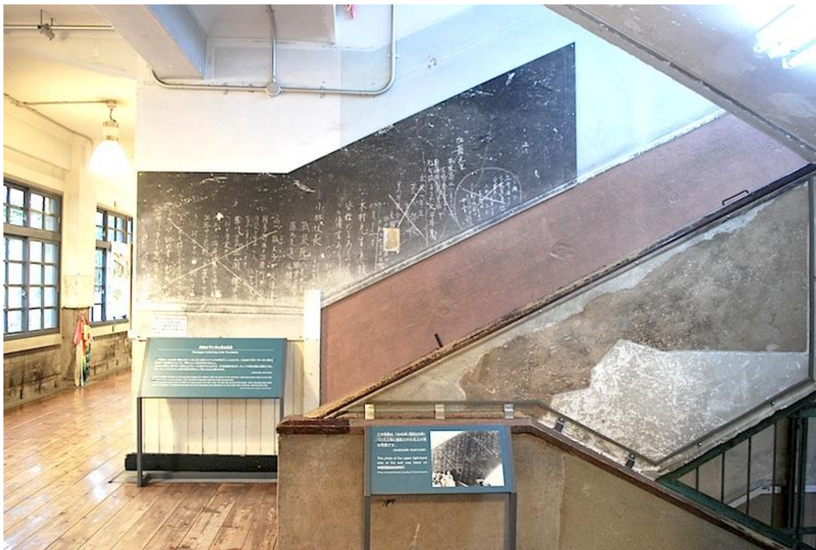
袋町小学校 平和資料館