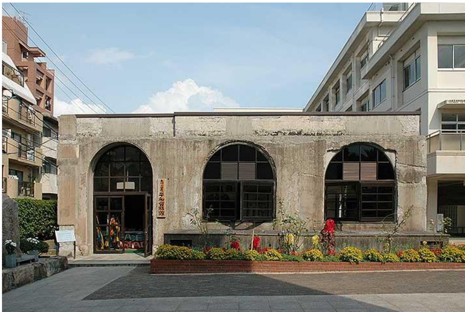
本川小学校平和資料館