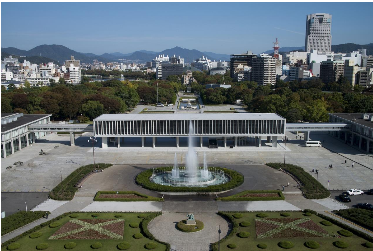
広島平和記念資料館