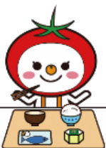
大阪市食育推進キャラクター

これらを摂りすぎると、生活習慣病を引き起こすリスクが高まります。中学生の時期に健康に良い食習慣を身に付けることは、生活習慣病を予防し、生涯を通して健康で豊かな生活を送ることにつながります。健康を支える3本の柱である「栄養のバランスの良い食事」、「適度な運動」、「十分な休養」を心がけましょう。