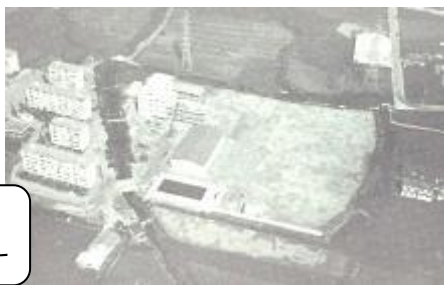
開校当時の校地 周りはたんぼです

開校以来、毎年生徒が増加し昭和53年度には1,257名を数えますが、昭和60年以降急激に減少に転じます。この3月までの卒業生総数は8,005名を数えます。皆さんの中にはお父さん、お母さんが卒業生だという人もいますね。歴史を重ねてきて、来年の3月には、3年1組1番のAさんに8,006番の卒業証書を渡すことになります。先輩たちが培ってきた良いところを受け継いで、皆さんが誇りに思える六反中学校にしていってください。