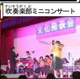
吹奏楽部ミニコンサート