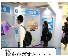
指をかざすと・・・