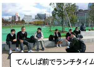
てんしば前でランチタイム