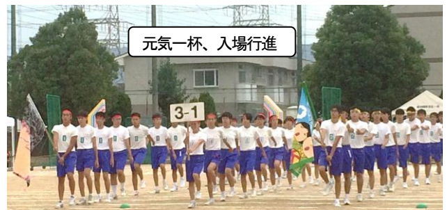
元氣一杯、入場行進

「平日にスマホなどでゲームを3時間以上する」生徒が 35.8%に上ることもあり、家庭学習に大きな課題がある 生徒が多いことが分かります。この結果を分析し活かし ながら、今後の教育活動を進めてまいりますので、 保護者の皆さまのご協力をお願いいたします。