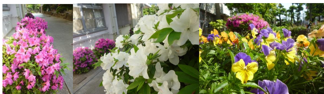
白いつつじも、とてもきれいです。玄関の花壇にはパンジーが綺麗に咲いています(^_-)☆

★緊急事態宣言中のいきいき活動参加にあたってのお願い★ ★裏面に記載しています。必ずお読みください。★