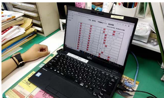
⑦ 採点用アプリを導入しました