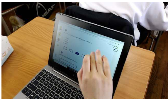
⑤ デジタルドリルで学習中です