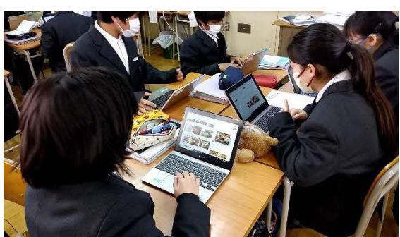
⑨ 対話学習に役立っています