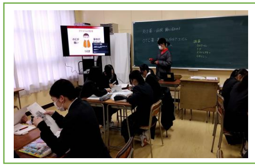
⑧ 電子黒板は必須アイテムです