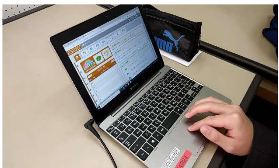
⑪ 『心の天気』入力中です