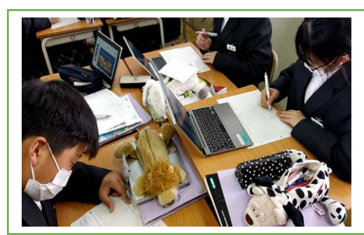
⑩ 調べ学習にも役立っています