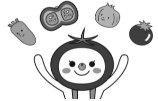
大阪市食育推進キャラクター 「たべやん」

大阪市では「第4次大阪市食育推進計画」（令和6年3月策定）に基づいて、食育を推進しています。その計画の中で、令和7年度は「野菜を食べよう」をテーマに取り組みを進めています。