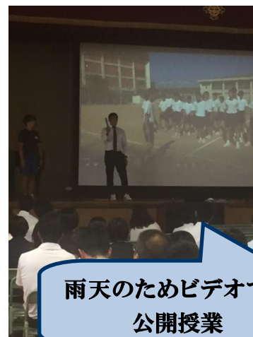
雨天のためビデオでの 公開授業