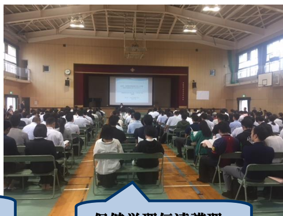
保健学習伝達講習