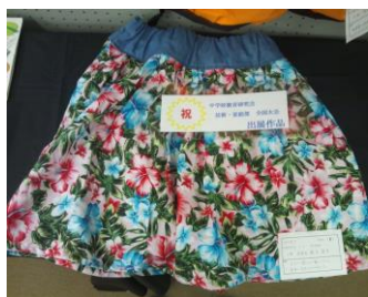
色の切り替えが素敵なパンツ