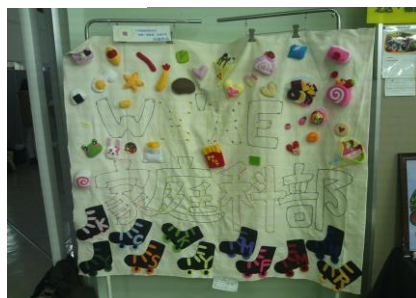
楽しくなる部活タペストリー