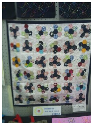
細かなパッチワーク