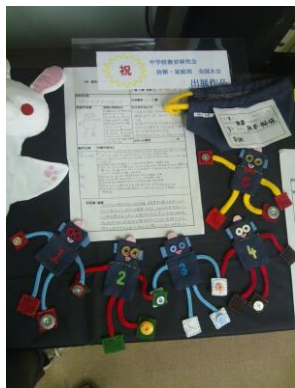
ボタンでつながるおもちゃ