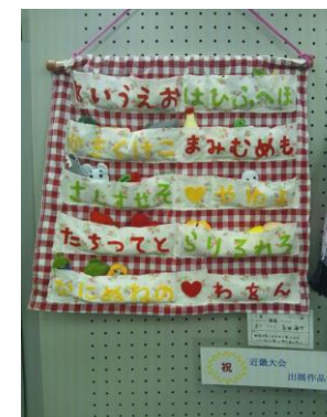
楽しくあいうえお