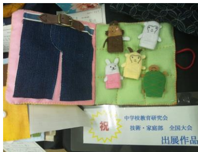
工夫たっぷり布えほん