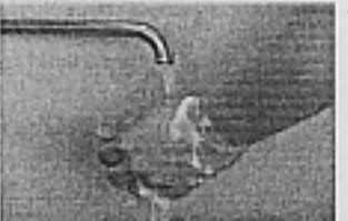
⑥水でよく洗い流す