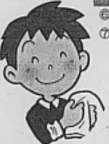
⑦清潔なハンカチなどで拭く