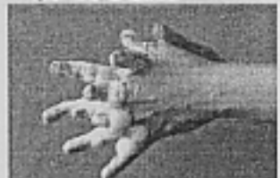
④手の甲、親指、他の指の間を洗う